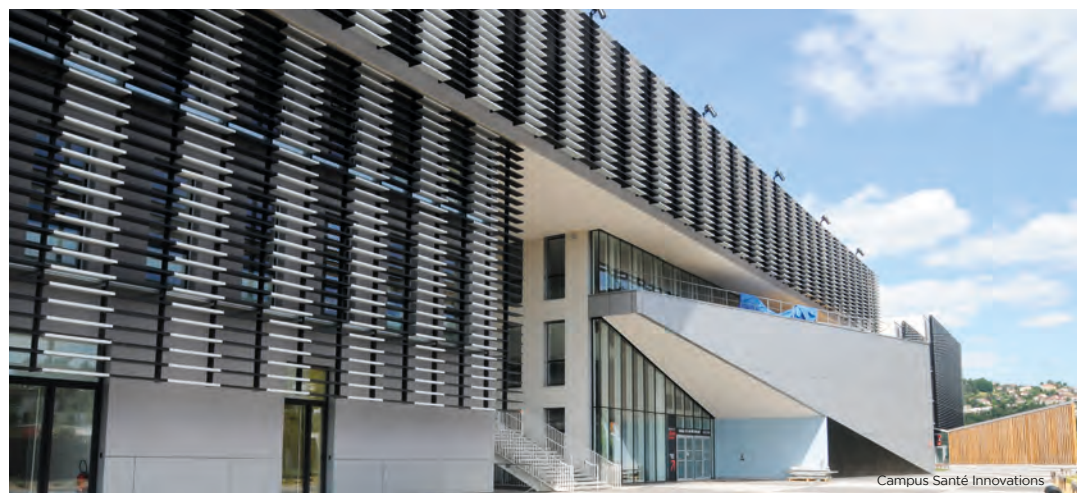
Campus Santé Innovations